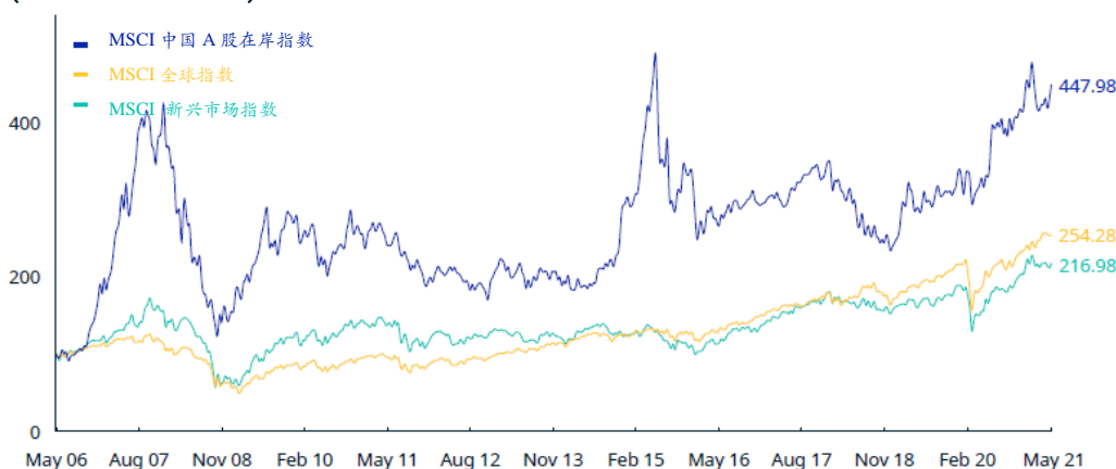
累计指数表现—总收益 (人民币) (2006/05 – 2021/05)