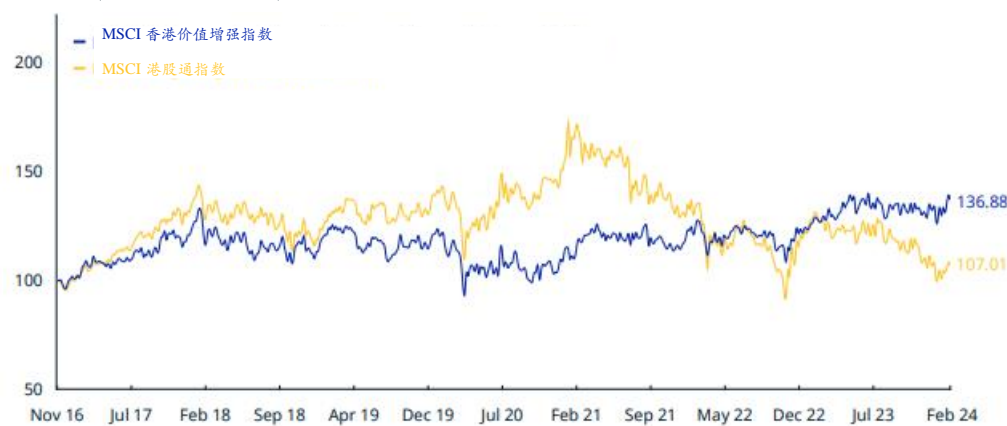
累计指数表现—总收益（人民币） (2016 年 11 月 – 2024 年 2 月)