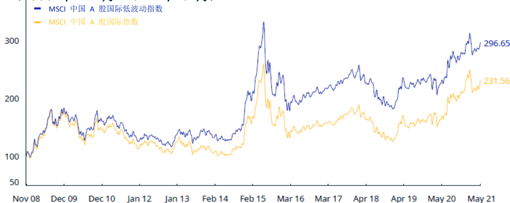
指数累计表现—价格收益（人民币） (2008 年 11 月-2021 年 5 月)